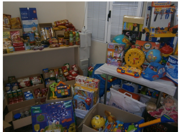
Alimentos y juguetes recogidos por Juventudes Socialistas de Membrilla en la campaña solidaria con destino a las familias necesitadas.

En todo momento, pero más en tiempo de crisis, los gobiernos deben acordar con los representantes sociales, qué modelo de convivencia quieren tener y cómo debe financiarse. Apostamos por una sociedad más formada e informada, más participativa y exigente.