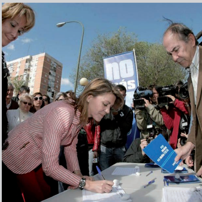
Cospedal apoyó la campaña de Esperanza Aguirre contra la subida del IVA

Eso era lo que decía Cospedal en la oposición cuando un medio de comunicación adelantó que el Gobierno de Zapatero lo estudiaba, algo que el Gobierno socialista desmintió y nunca hizo.