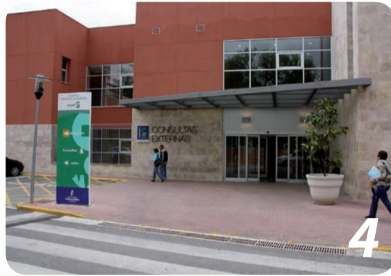
1. Hospital de Tomelloso - 2. Hospital de Villarrobledo - 3. Hospital de Almansa - 4. Hospital de Manzanares

El Estado del malestar de Cospedal: 937 millones menos para pasar de una sanidad de primera pública, gratuita y universal a una sanidad de tercera. El presupuesto en sanidad se reduce en un 23%. Esta es la sanidad que Cospedal quiere para Castilla-La Mancha: