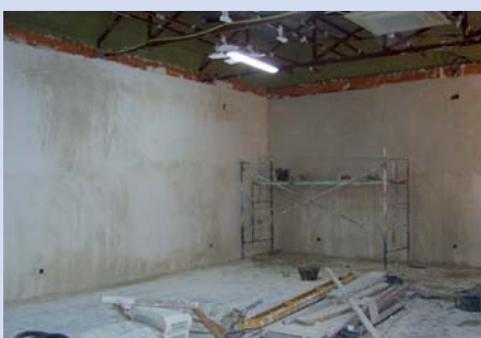
Escuela Taller. Cámara agraria