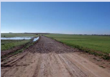
Arreglo de caminos