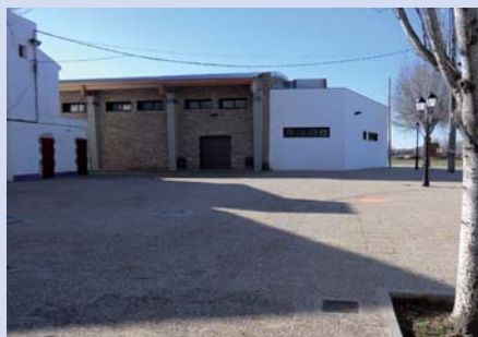
Accesos Pabellón Multiusos