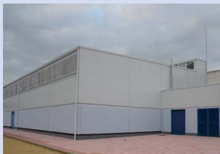
Apertura Gimnasio San José