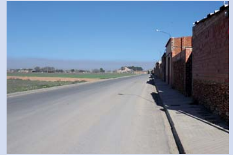
Pavimentaciones: Ramón y Cajal, Segador, Mesta, Carretera de La Solana y aparcamiento del Espino.