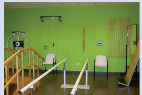
Ampliación centro día